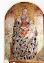
Badia di S. Maria della Neve