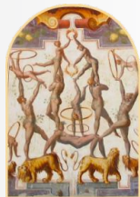
Cortile d'Onore del Castello